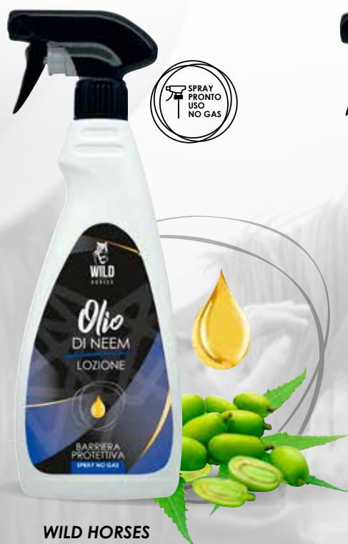
WILD HORSES OLIO DI NEEM SPRAY 500ML / 1LT