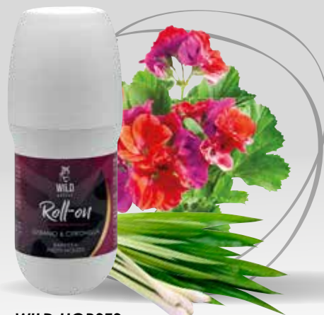
WILD HORSES ROLL-ON GERANIO & CITRONELLA 75 ML