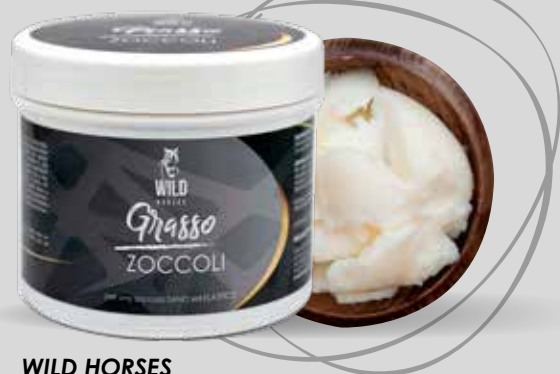
WILD HORSES GRASSO ZOCOLI 500G / 1KG / 5KG