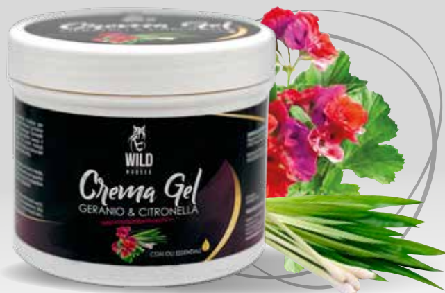
WILD HORSES CREMA GEL GERANIO & CITRONELLA 500G / 1KG