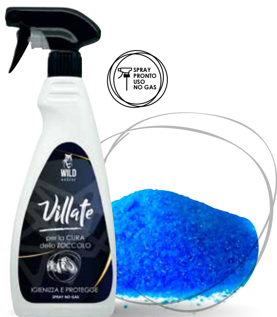
WILD HORSES LIQUIDO VILLATE SPRAY 500ML / 1LT