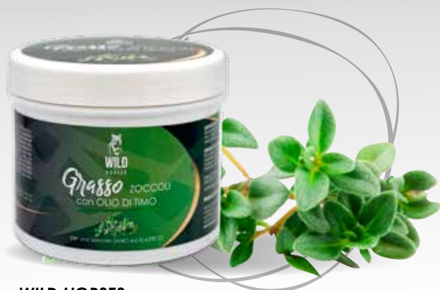
WILD HORSES GRASSO ZOCOLI AL TIMO 500G / 1KG / 5KG