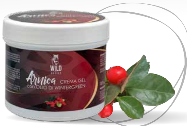
WILD HORSES ARNICA + WINTERGREEN 500G