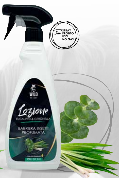
WILD HORSES LOZIONE EUCALIPTO & CITRONELLA SPRAY 500ML / 1LT