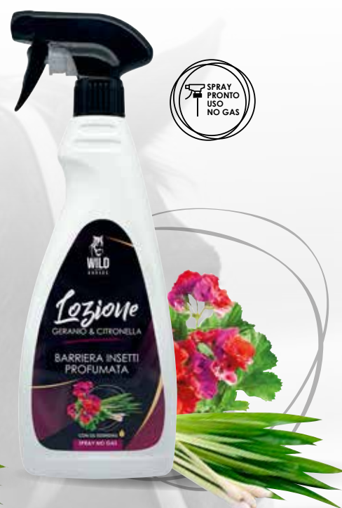
WILD HORSES LOZIONE GERANIO & CITRONELLA SPRAY 500 ML / 1LT