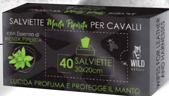
WILD HORSES SALVIETTE DETERGENTI MENTA PIPERITA 40PZ