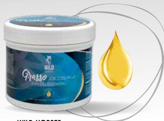
WILD HORSES GRASSO ZOCOLI PLUS 500G / 1KG / 5KG