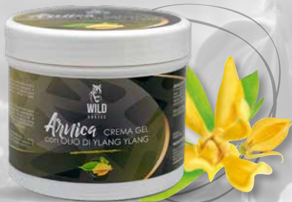
WILD HORSES ARNICA + YLANG YLANG 500G