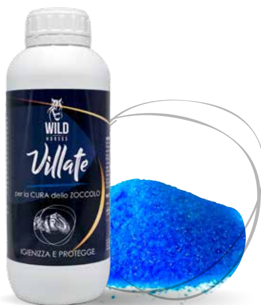
WILD HORSES GEL VILLATE 250ML / 500ML / 1LT