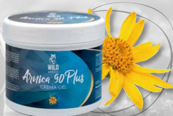
WILD HORSES ARNICA 90 PLUS 500G