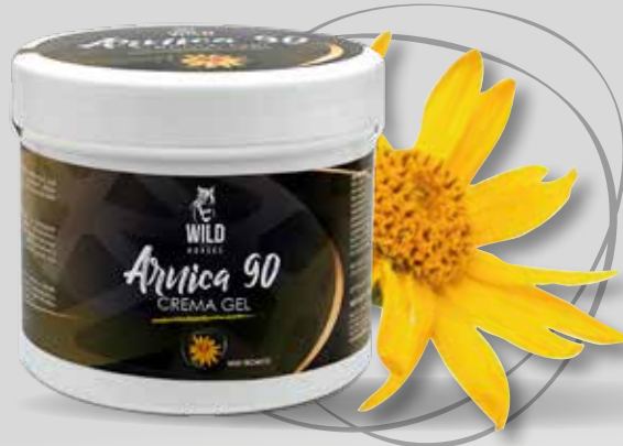
WILD HORSES ARNICA 90 500G/1KG