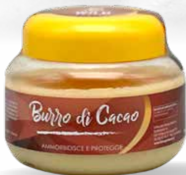
WILD HORSES BURRO CACAO MELA VERDE/CLASSICO 180 G