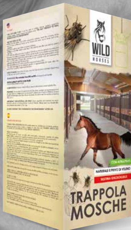
WILD HORSES TRAPPOLA MOSCHE 750ML