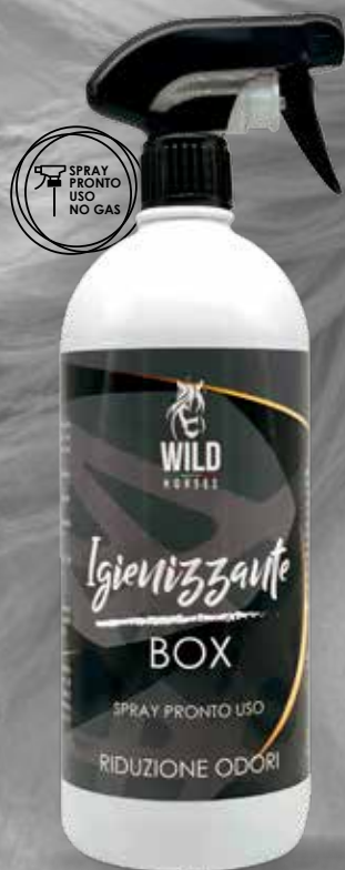
WILD HORSES IGIENIZZANTE BOX SPRAY 1LT