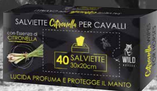
WILD HORSES SALVIETTE DETERGENTI CITRONELLA 40PZ