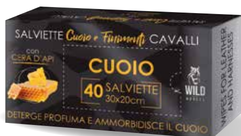
WILD HORSES SALVIETTE DETERGENTI CUIO E FINIMENTI CERA D'API 40PZ