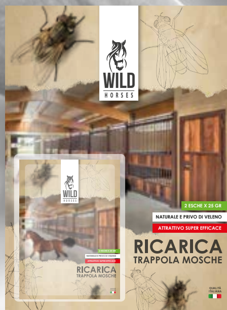
WILD HORSES RICARICA TRAPPOLA MOSCHE 25GX2