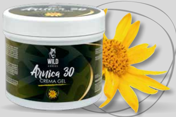
WILD HORSES ARNICA 30 500G/1KG