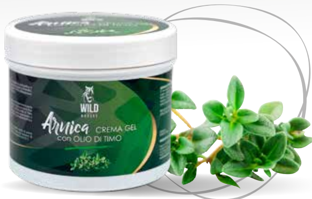
WILD HORSES ARNICA + TIMO 500G