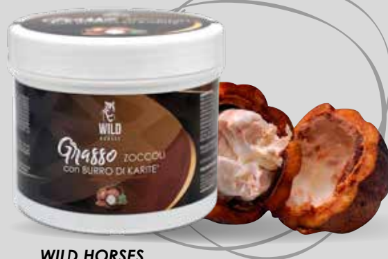
WILD HORSES BURRO KARITÉ' ZOCOLI 500G / 1KG / 5KG